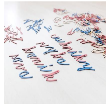
Potíže ve škole – dysgrafie